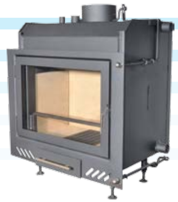
Neptun 2 / 2 Plus