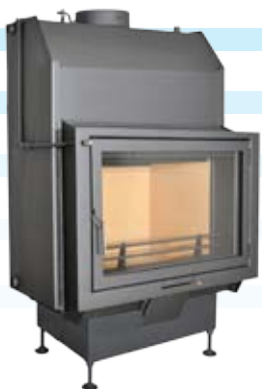
Nemo 2 / 2 Plus