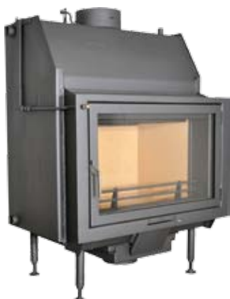
Nemo 4 / 4 Plus