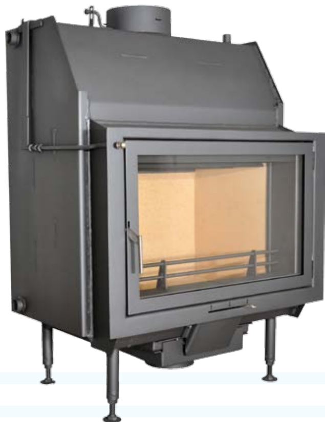
Nemo 10 / 10 Plus

высокая эффективность и плотность топки возможность монтажа с закрытой топкой - версия Plus