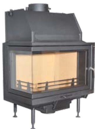
Nemo 4B / 4B Plus