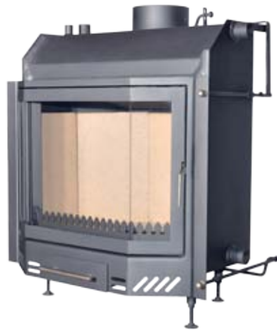
Neptun 3 / 3 Plus