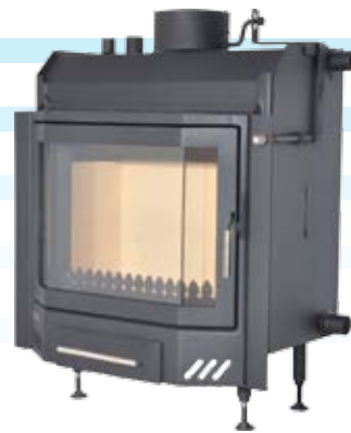
Neptun 1 / 1 Plus