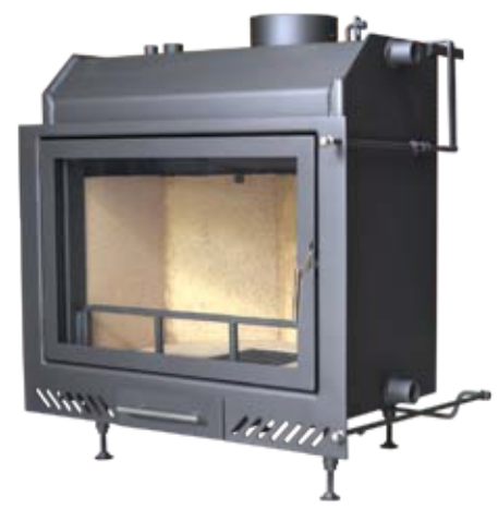
Neptun 4 / 4 Plus