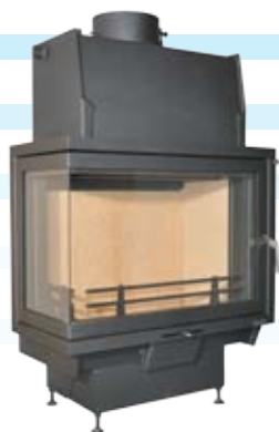
Nemo 2B / 2B Plus